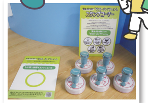
家族で取り組む「ゼロカーボンアクション」