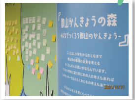
みんなの資源を次に生かそう