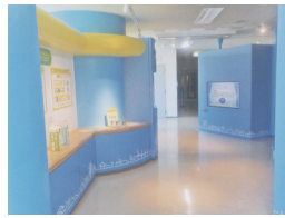
体感型環境学習施設コーナー