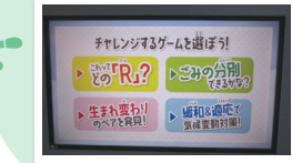
タッチパネルを使ったゲーム